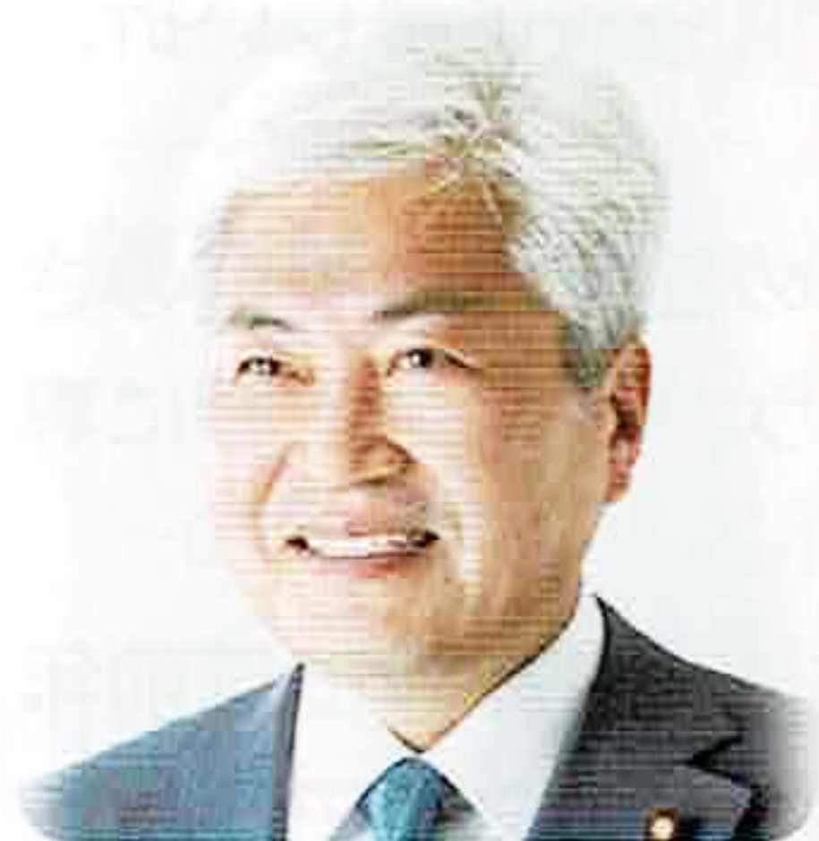
長野県第2区衆議院議員 務台 俊介

昨年は、新型コロナ5類への移行や、物価の高騰、少子高齢化の進展、国際情勢の不安定化など、激動の一年となりました。私自身も、農林水産大臣や自民党政調会長代理、自民党長野県連会長など様々な立場で政策の実現実行に邁進してまいりました。現在、看護の現場では、働き方改革など様々な課題に直面しておりますが、令和5年度補正予算の執行と診療報酬改定を含む令和6年度予算の早期成立を図ることにより、看護現場のDX促進や、看護の専門性発揮に資するタスク・シフト/シェアの円滑化、物価高騰に対応するための持続的な賃金引上げの実現を目指してまいります。私は今年も、自民党看護問題対策議連の副会長として長野県看護連盟の皆様とともに様々な課題の解決に取り組んでまいりたい決意です。結びに、長野県看護連盟の更なるご発展と、皆様のご健勝ご活躍を祈念し、年頭のご挨拶とさせていただきます。