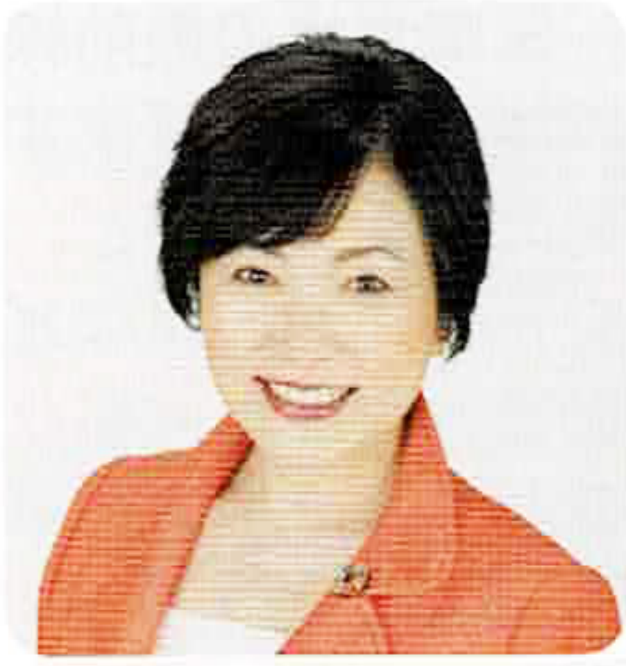
衆議院議員 あべ 俊子