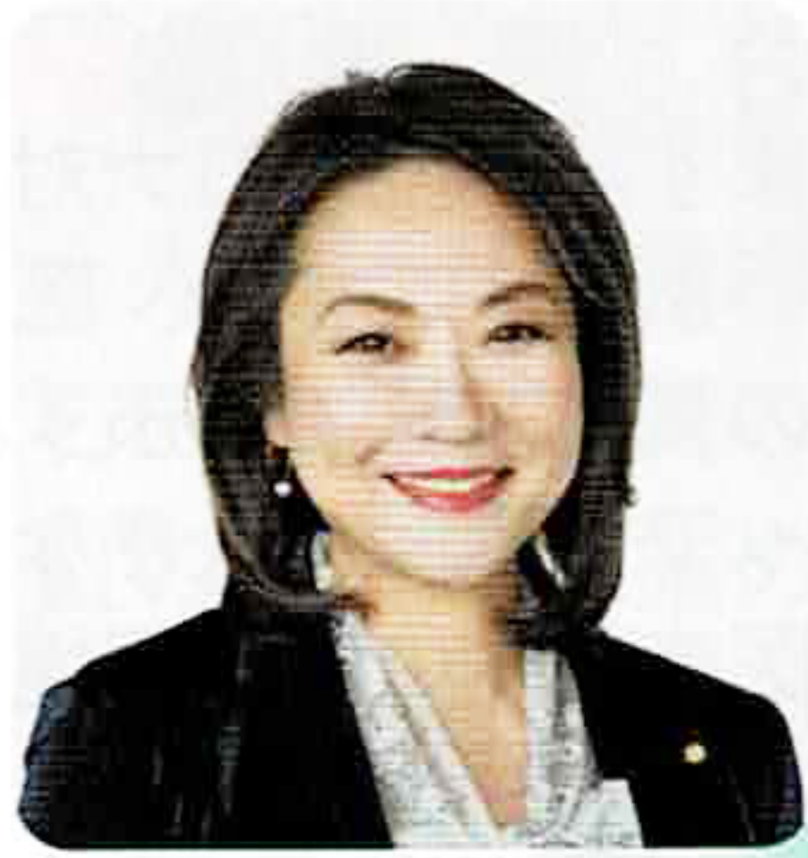
衆議院議員 たかがい 恵美子

時代は大きく動いていますが、いつの時も政策立案の基本となるのは現場の声です。人や社会を支える看護が、誇りをもって提供できる環境整備も重要です。より一層のご指導をよろしくお願いいたします。