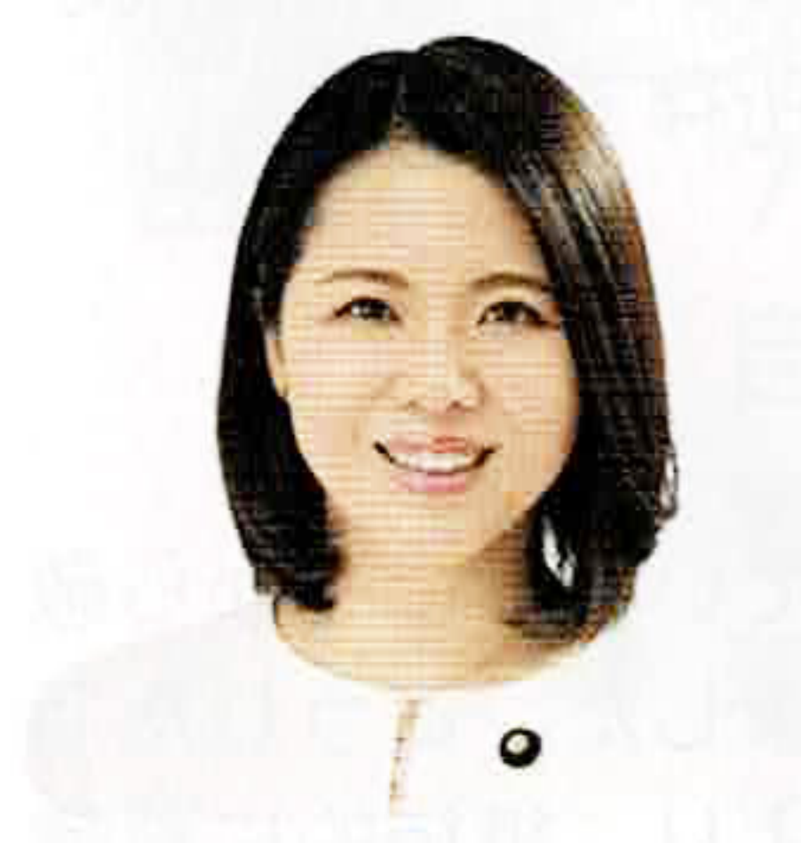
参議院議員 友納り お

国会においては、予算委員会理事（次席）、厚生労働委員会委員、参議院自民党国会対策委員会副委員長を拝命いたしました。特に、予算委員会は社会の注目を集める難しい委員会ですが、役目をしっかりと果たしていけるよう尽力いたします。また、国会対策委員会副委員長として円滑な国会運営に向けて走り回ると共に、厚生労働政策を推し進めていきます。本年も引き続き、現場の声をしっかり受け止め、看護連盟・看護協会と連携しながら活動して参ります。