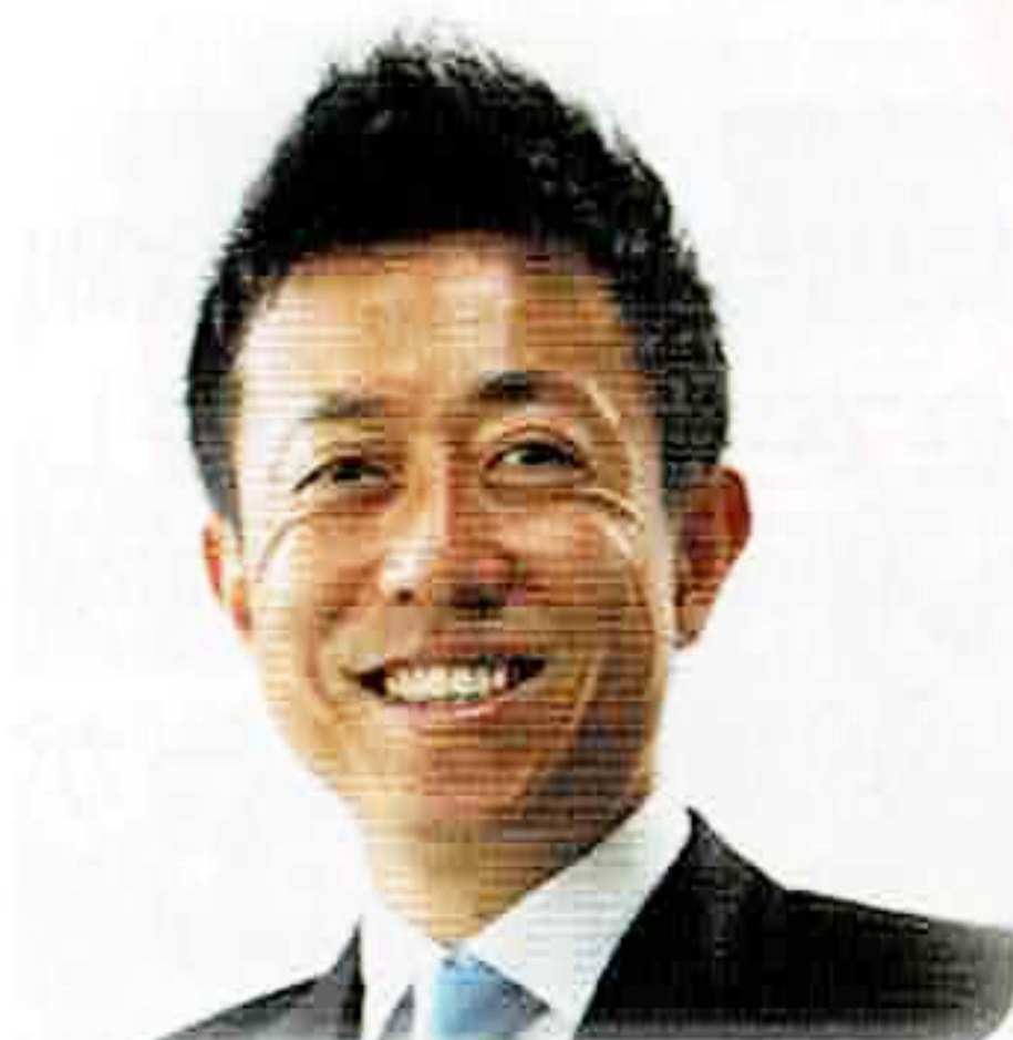
長野県第3区衆議院議員 井出 庸生

医療現場の困難を、現場を熟知されている看護師の皆様の問題意識を我々政治家がしっかりと受け止めていくことをお約束申し上げ、新年のあいさつに代えさせていただきます。