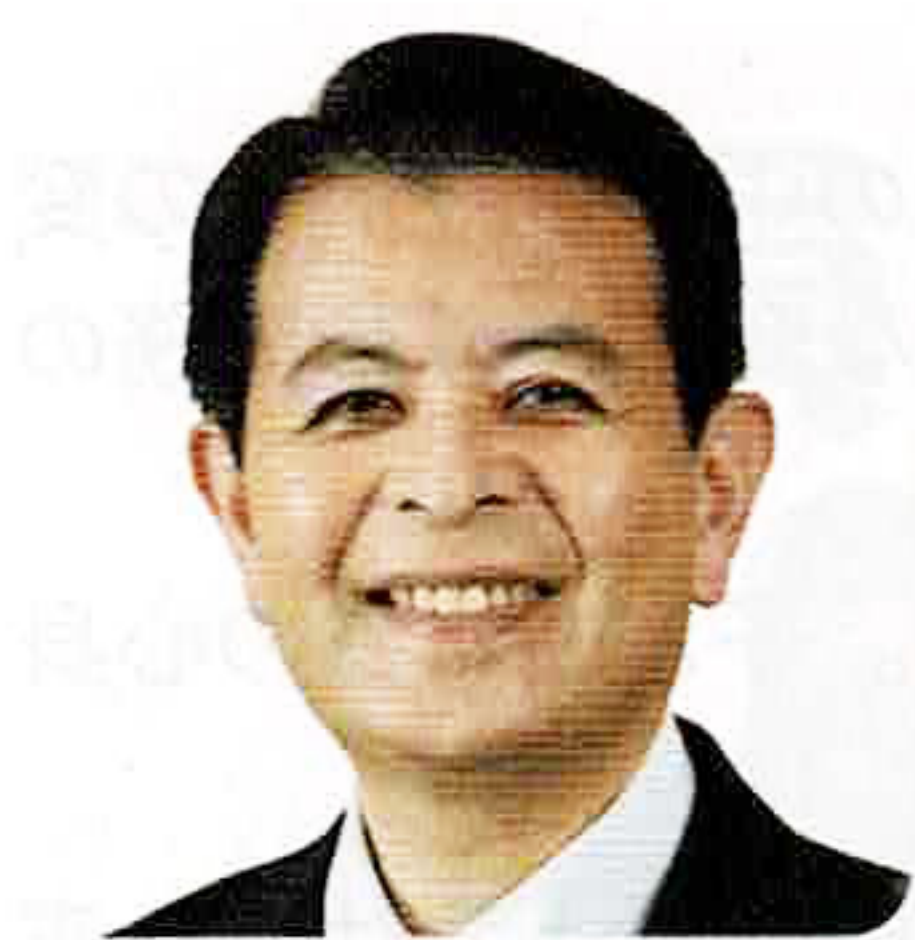
長野県第5区衆議院議員 宮下 一郎

謹んで新春のお慶びを申し上げます。長野県看護連盟の皆様におかれましては、医療現場の最前線において県民の健康と福祉の向上にご尽力を頂いておりますことに心から敬意と感謝申し上げます。