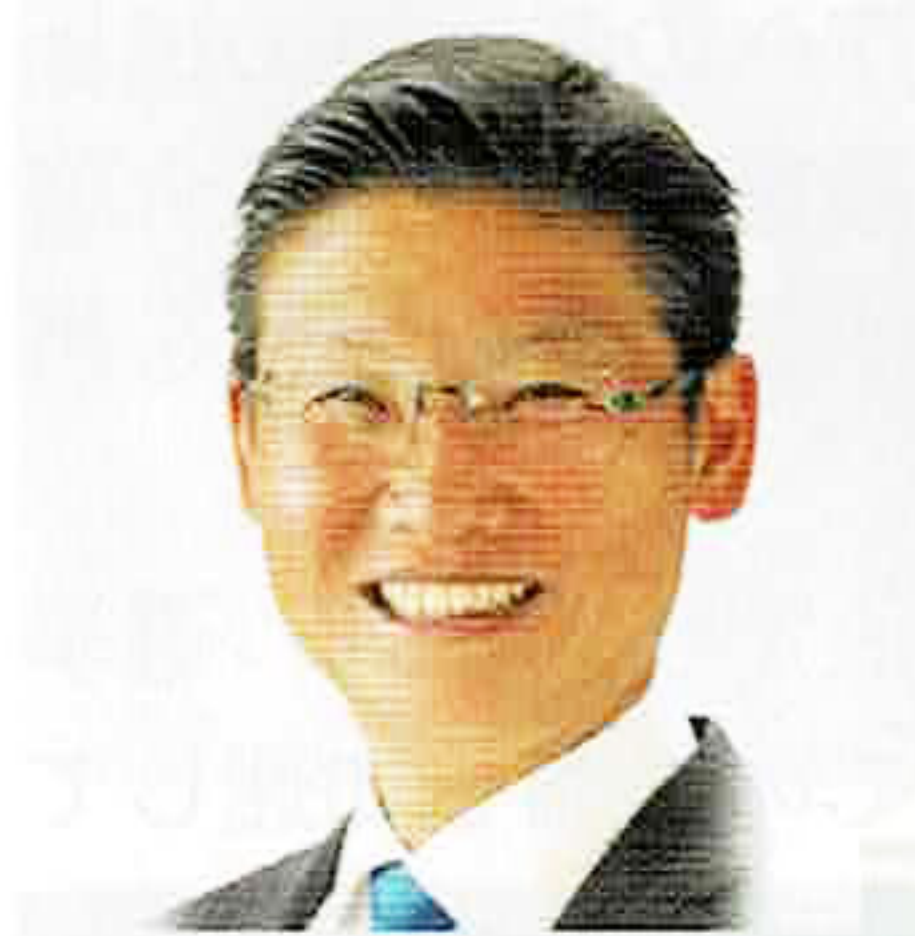
長野県第1区衆議院議員 若林 健太