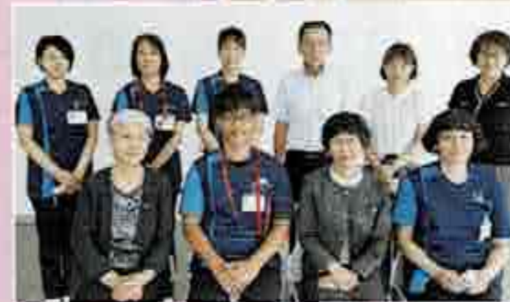
北アルプス医療センターあづみ病院