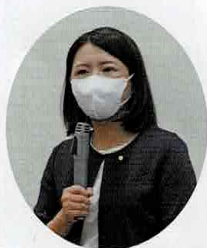
参議院議員 友納 理緒