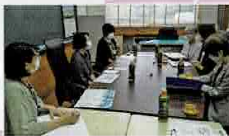
信州木曾看護専門学校