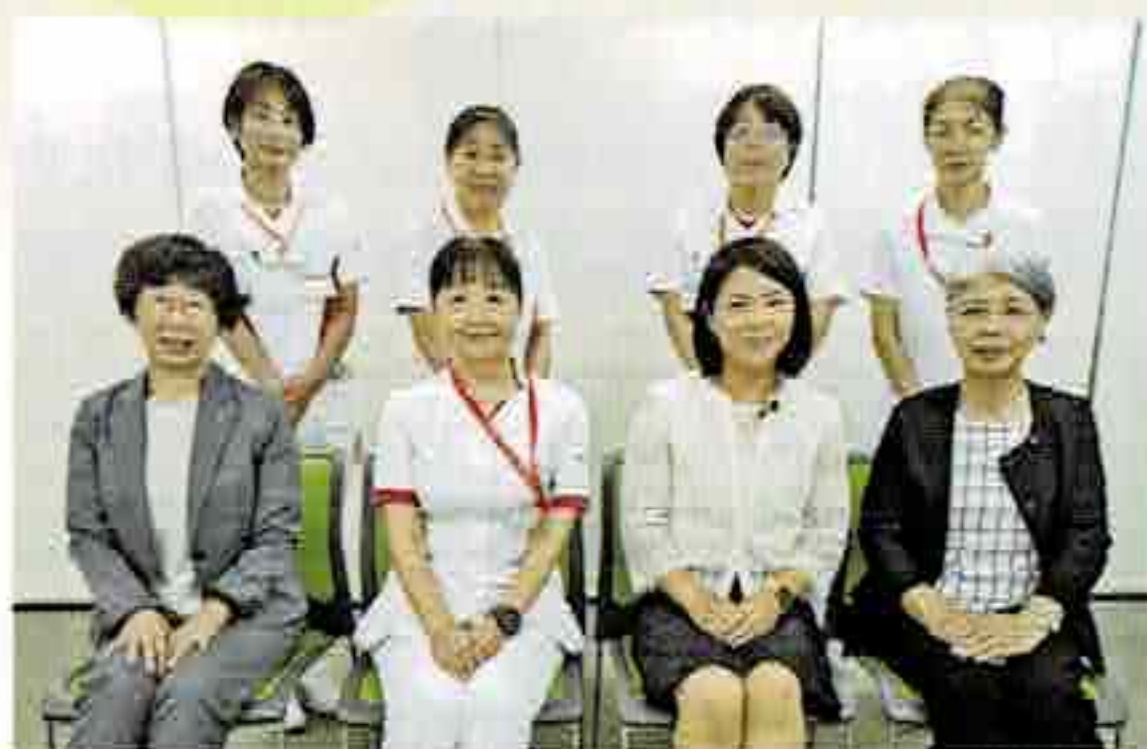
信州大学医学部附属病院にて