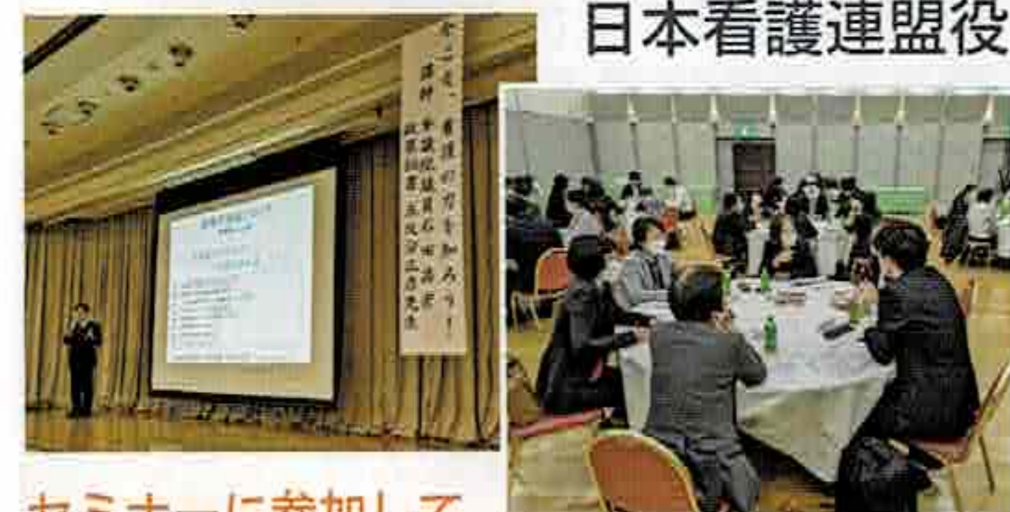
セミナーに参加して

2年ぶりの集合開催となった政策セミナーは、①看護管理者・看護教育者等として看護を取り巻く環境を共通理解する。②日本看護協会の看護職の処遇改善に向けた取り組みを理解し、施設における処遇改善に向けた働きかけを支援する。③Z世代の政治参加に向けた方策を見出す。を目標に開催された。今回、Z世代に関連するテーマがあり、看護教育者からも前向きな発言が聞かれ、充実したセミナーとなった。