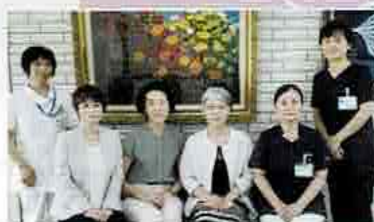
瀬口脳神経外科病院