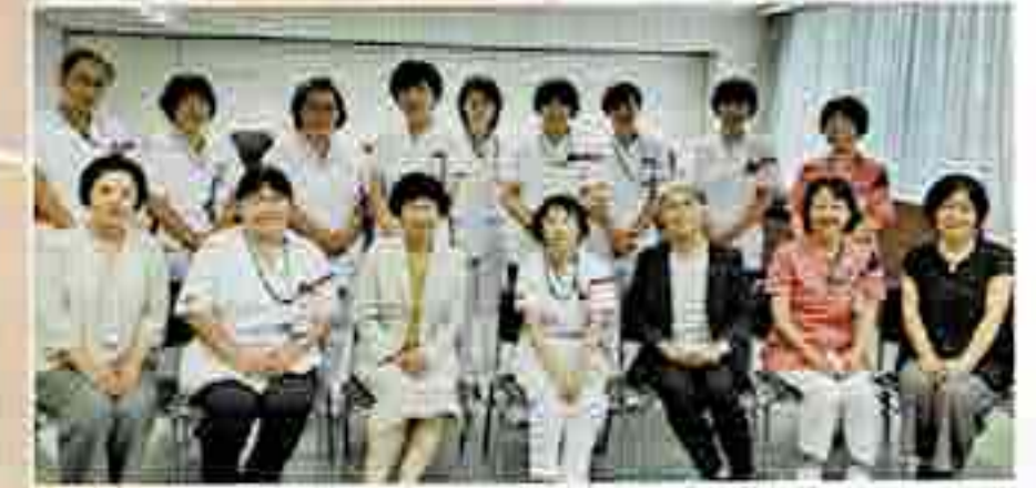
県立信州医療センター