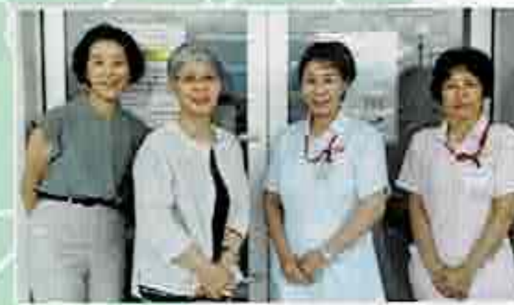
下伊那赤十字病院