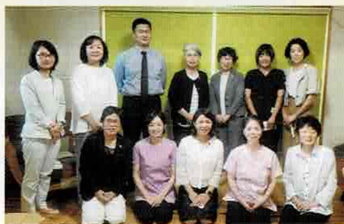
はぎもと助産院の皆様と