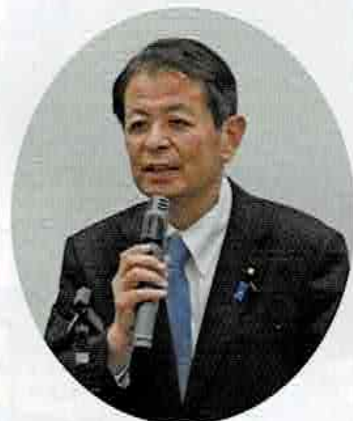
衆議院議員・農林水産大臣 宮下 一郎