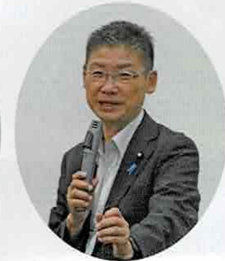
衆議院議員 若林 健太