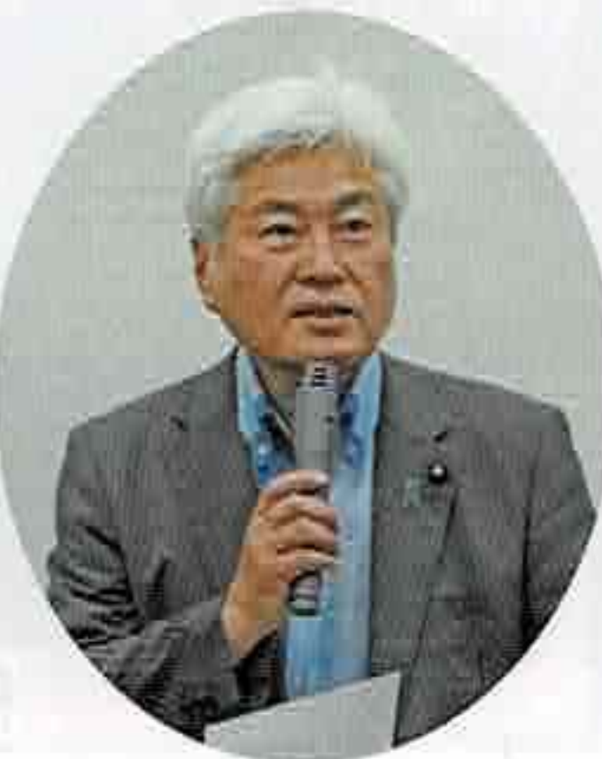
衆議院議員 務台 俊介