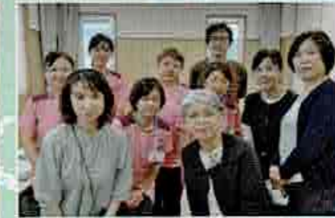
佐久穂町立千曲病院