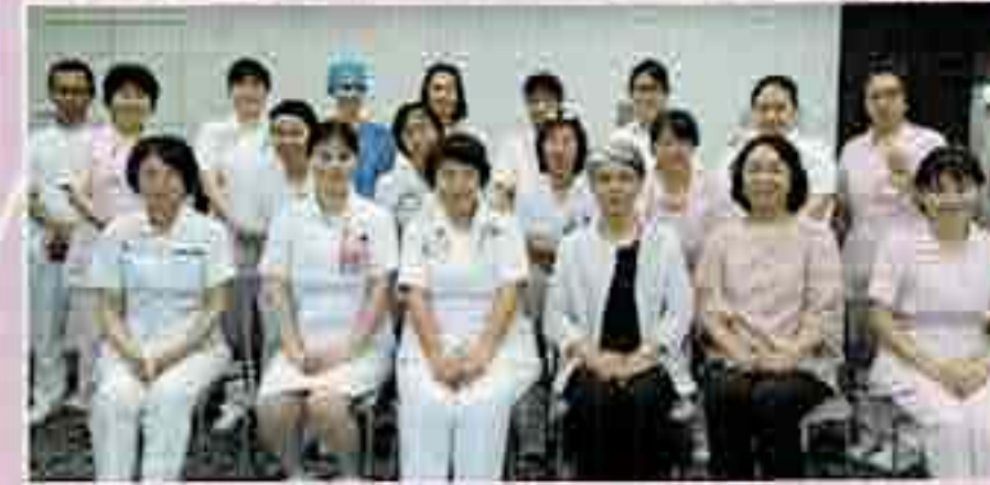
安曇野赤十字病院