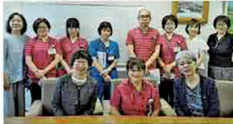
市立大町総合病院