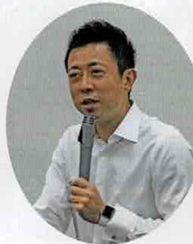
衆議院議員 井出 庸生