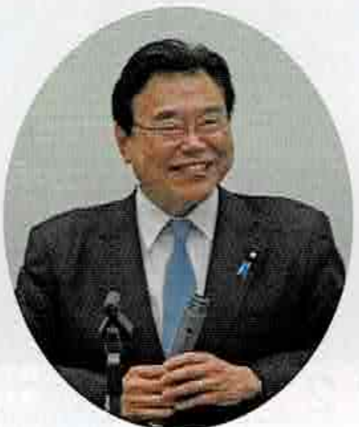
衆議院議員 後藤 茂之