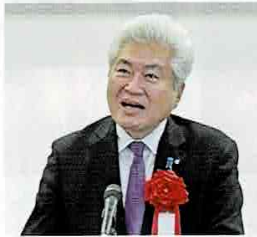
衆議院議員 務台俊介様