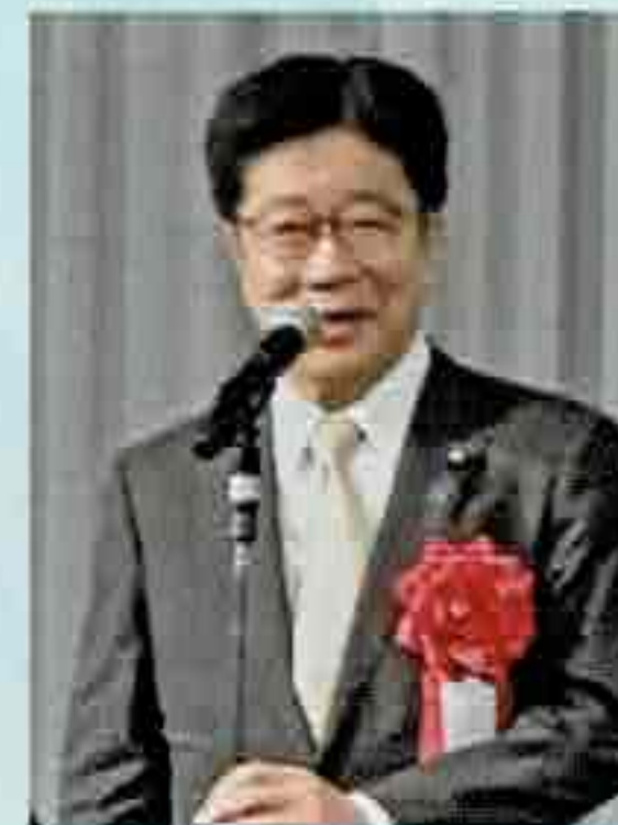
厚生労働大臣 加藤 勝信 様