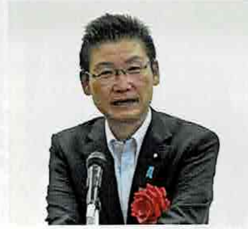
衆議院議員 若林健太様