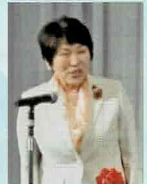
衆議院議員 あべ 俊子 様