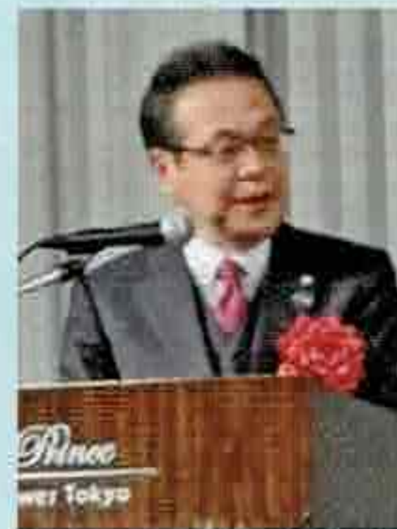
参議院自由民主党幹事長 世耕 広成 様