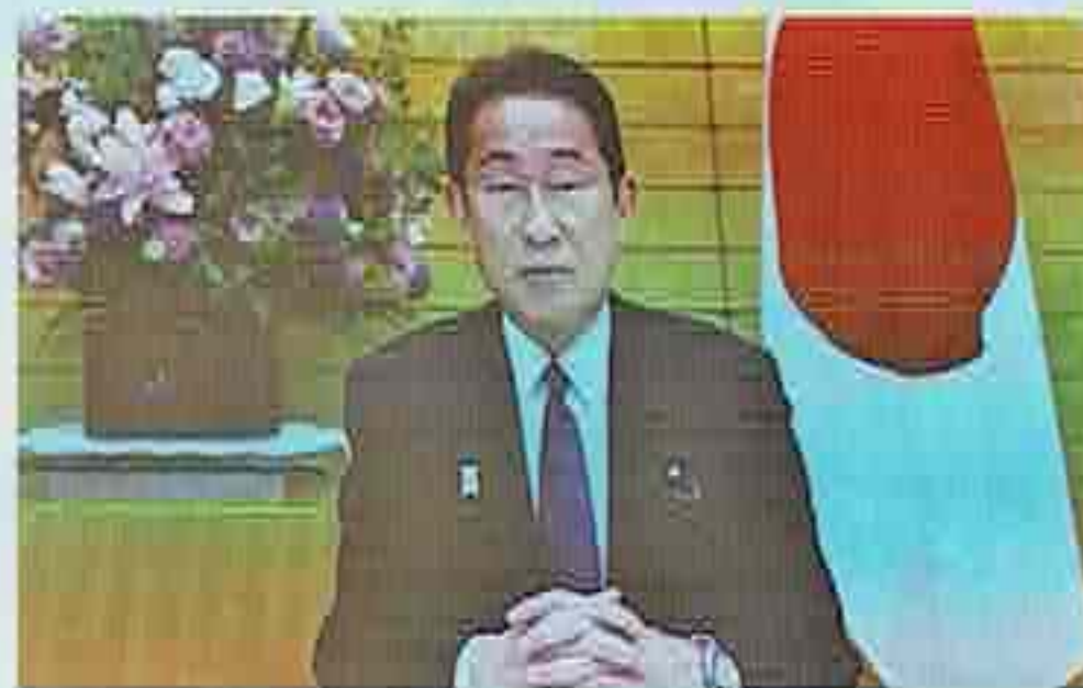
自由民主党総裁 岸田 文雄 様