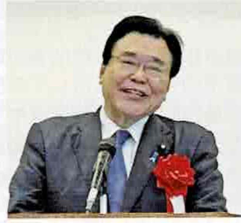
衆議院議員 後藤茂之様