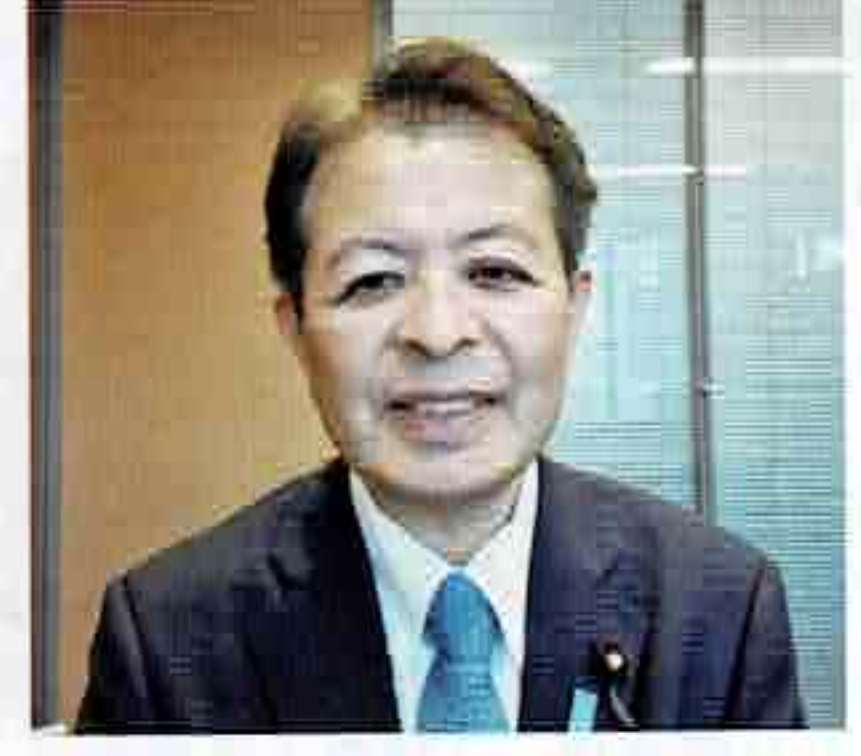
衆議院議員 宮下一郎様