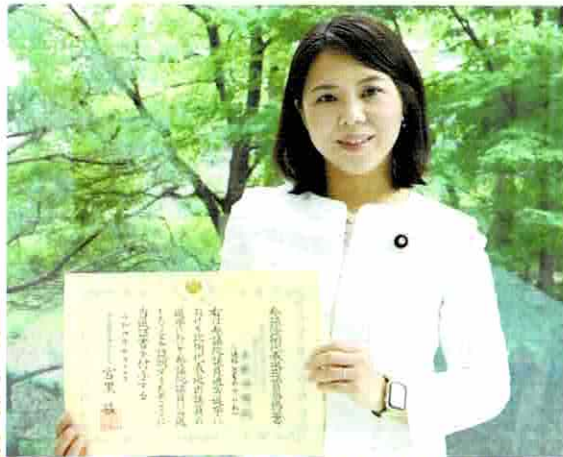
当選証書と議員バッジをつけて