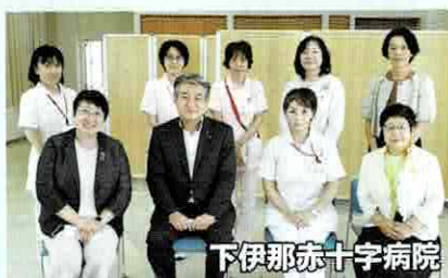
下伊那赤十字病院