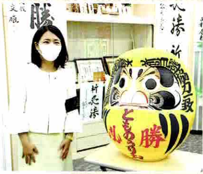
参議院選当選 (7月10日)