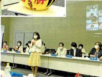
都道府県会 長会で決意 を語る (7月20日)