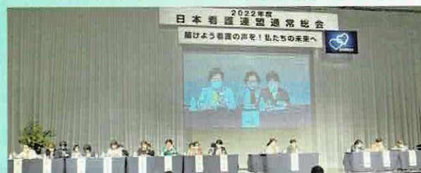
来賓挨拶 参議院議員 石田 昌宏